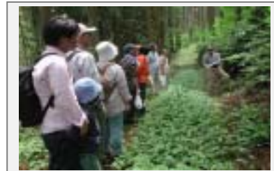
つぐっぺおらほの復興家づくりの会の体制